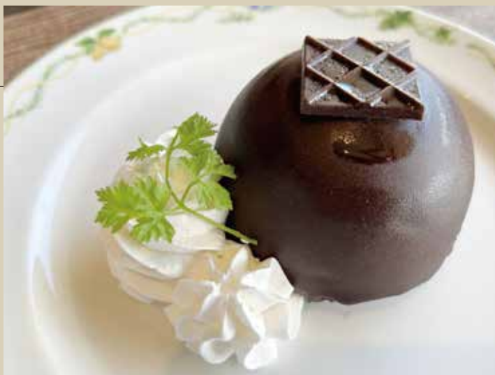
三層チョコのドームケーキ 900円