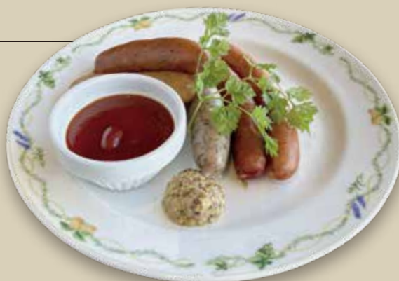
ソーセージ5種盛り合わせ 1,000円