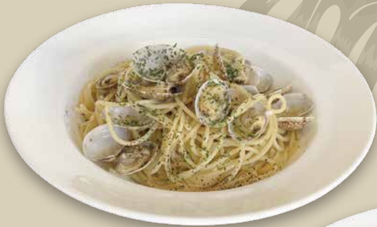
ボンゴレビアンコ 1,500円