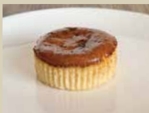
バスクチーズケーキ