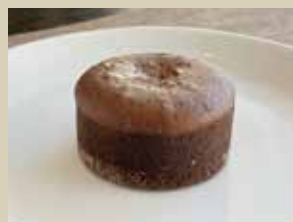
フォンダンショコラ