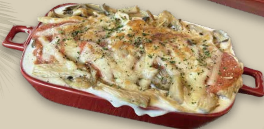
明太きのこドリア 1,400円