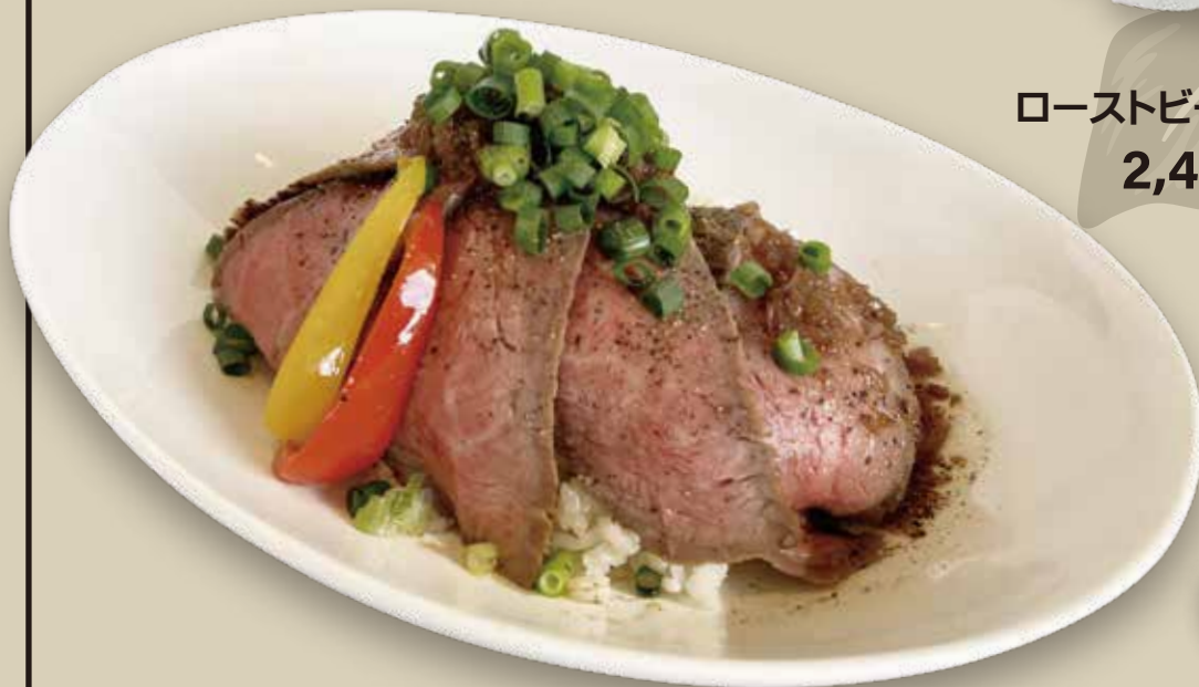
ローストビーフ丼 2,400円