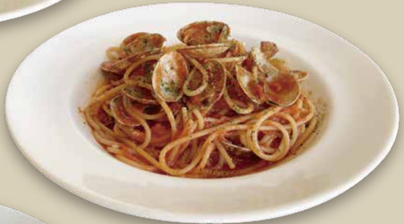
ボンゴレロッソ 1,500円